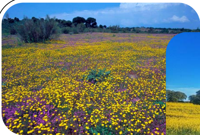
Zonas de cultivo

La primavera trae lluvias, insectos, aves... vida. Es una estación para disfrutar de los colores, los olores y un sinfín de sensaciones. Observa estas imágenes y piensa ¿Qué recuerdos te traen? ¿Has estado en algún lugar parecido?